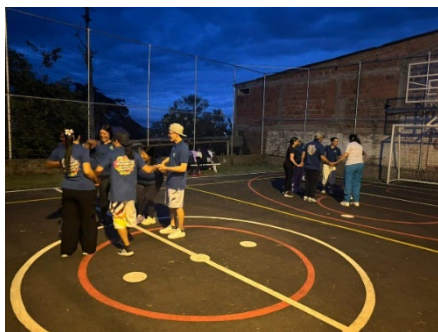
Registro Fotográfico 27 de mayo del 2026, - Calima el Darién Valle del Cauca